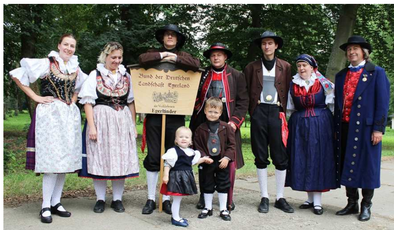
Egerländer Volkstanzgruppe „Die Målas“