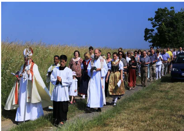
Leben im Glauben (Wallfahrt Maria Stock)