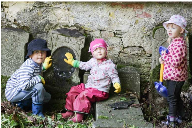
Jugendbegegnung in Tepl (Friedhofspflege)