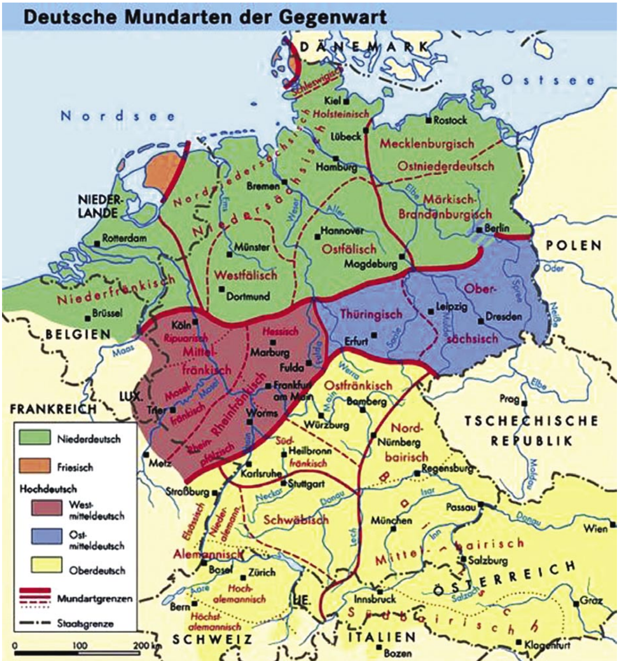
Deutsche Mundarten heute