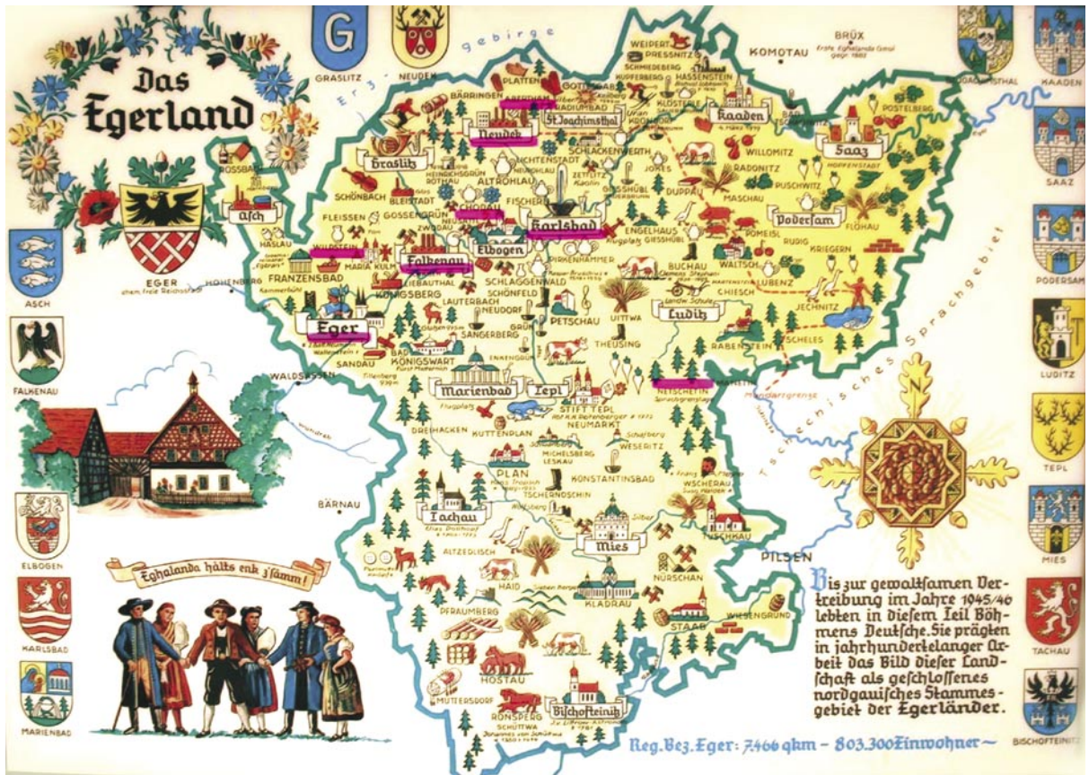
Das Egerland um 1930