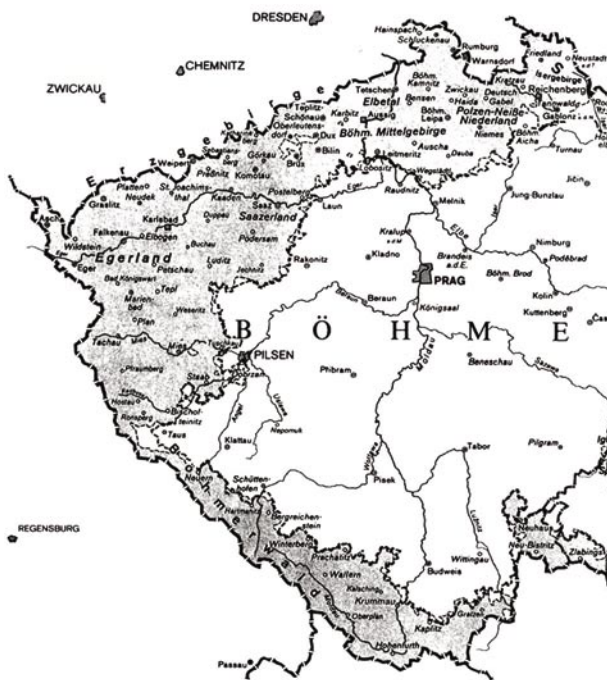
Das Sudetenland auf dem böhmischen Gebiet