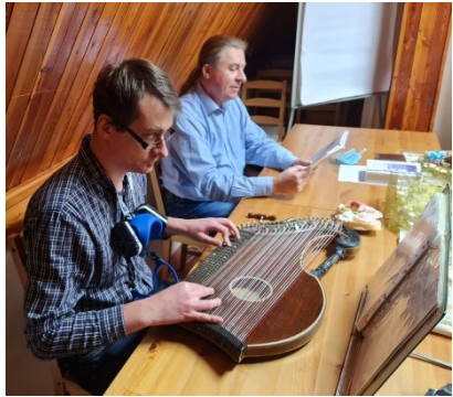
o.: die „Málaboum“ bei der Lesung in Pilsen.