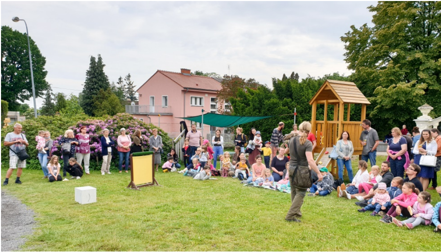
o.: Dt.-tsch. Kindertag in Pilsen