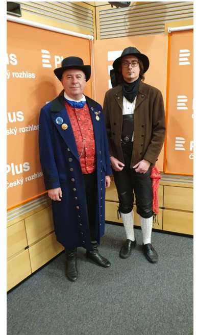
o.: die Málaboum im Tschechischen Rundfunk in Prag, Aufnahmen.