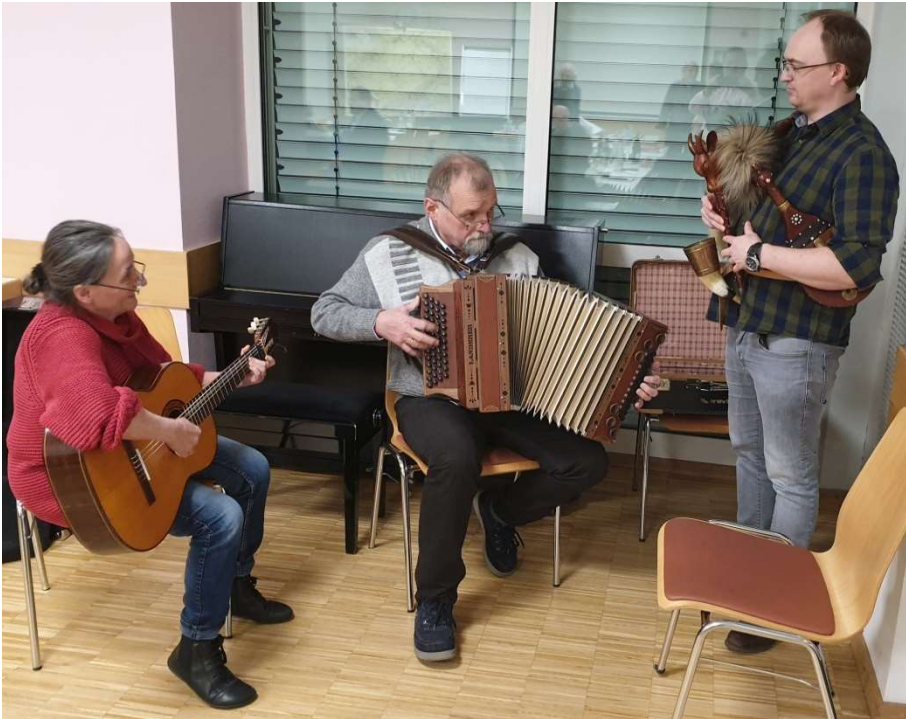
o.: aus der Mundarttagung in Bad Kissingen