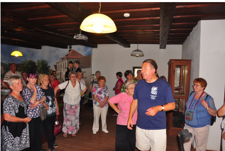
o.: Graslitzer Kulturverband in Netschetin