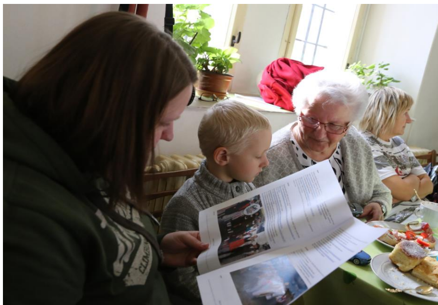
o: auch ganz kleine zukünftige Mitglieder dabei