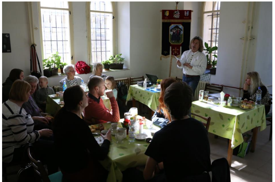
o: Vorsitzender bei seinem Jahresbericht

Die größten Projekte wurden vom BMI, sowie vom „Tschechischen Kulturministerium“ (KM) und dem „Deutsch-tschechischen Zukunftsfonds“ (ZF) mitfinanziert. Jedes Jahr, immer von „Christi Himmelfahrt“ bis zum darauffolgenden Sonntag fand im Jahre 2016 schon zum 23. Mal die „Jugendbegegnung im Stift Tepl“ statt. Die letzten drei Jahre beteiligte sich neben den Egerländern aus Netschetin und Deutschland auch die Stadt Tepl. Sogar zur Kranzniederlegung der Opfer des Todesmarsches auf dem städtischen Friedhof wurde der Vorsitzende des Bundes eingeladen. Die „Wandernden Egerländer Musikanten“ waren 2016 zu Besuch in Marienbad. Mit einem Doppelkonzert im „Rübezahl“ am Samstagabend und in der