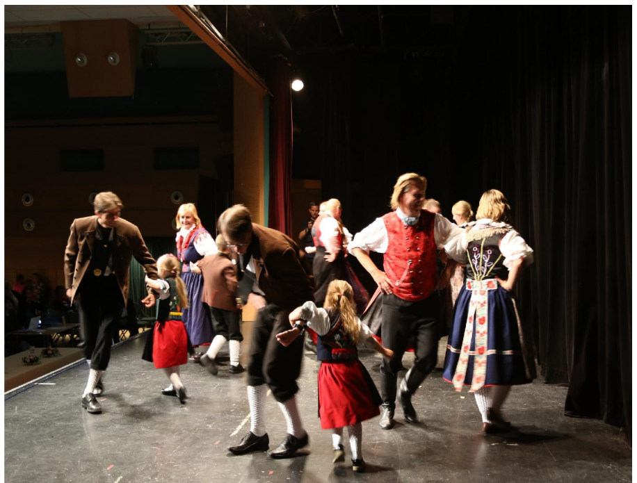
o: „Die Målas“ mit den Kleinsten beim Auftritt.