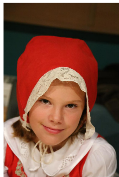
o: das Pilsner Rotkäppchen.

http://www.deutschboehmen.com/berichte/berichte/500-zuschauer-in-prag-grossveranstaltung-in-prag-2016/all-pages