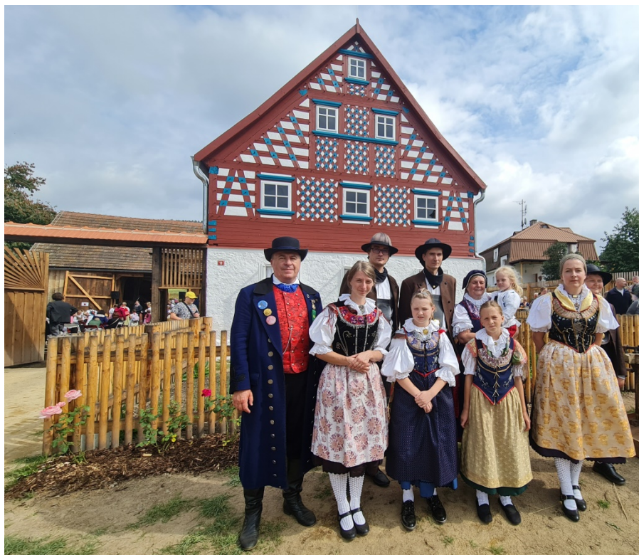
o.: Die Målas.